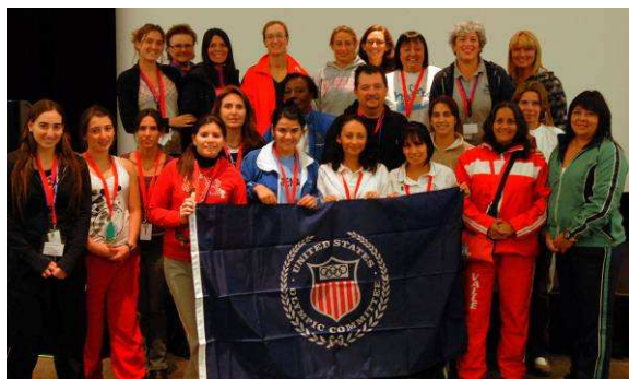
Foto de familia del curso para entrenadores y jueces de natación sincronizada en Colorado Springs.

un protocolo de colaboración para el estudio a detección de las alteraciones genéticas cardiovasculares relacionadas con la muerte súbita en deportistas de alto nivel. Al acto asistieron más de 350 personas. Comunicado en www.coes.es