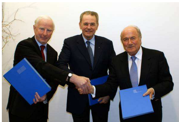
(De izqda. a dcha.) Patrick J. Hickey, Jacques Rogge y Joseph S. Blatter.

Patrick J. Hickey, presidente de los Comités Olímpicos Europeos (COE), y Joseph S. Blatter, presidente de la Federación