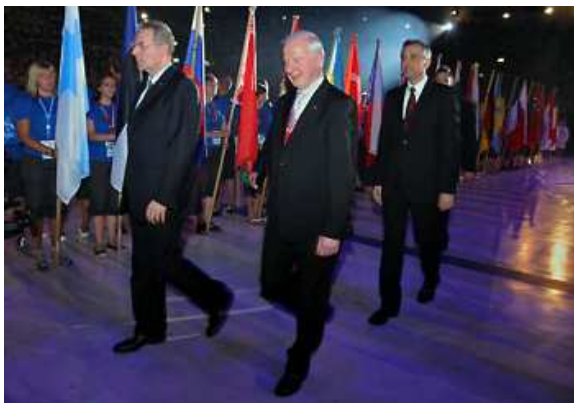
El presidente Rogge con Patrick J. Hickey (dcha.) y Ján Figel' (detrás) en la inauguración del FOJE en Tampere.

El pasado 19 de julio, el presidente del COI, Jacques Rogge , asistió a la ceremonia de apertura del X Festival Olímpico de la Juventud Europea (FOJE) –edición de verano– en Tampere (Finlandia) acompañado por el presidente de los Comités Olímpicos Europeos (COE) y miembro del COI, Patrick J. Hickey, y por el comisario europeo de Educación, Formación, Cultura y Juventud, Ján Figel'. Durante su estancia, el presidente Rogge tuvo la oportunidad de visitar la villa de los atletas y de asistir a algunas pruebas. También aprovechó la ocasión para participar en la inauguración del Parque Olímpico.