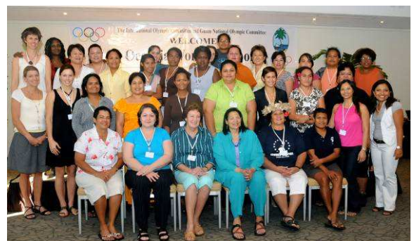
Las participantes en el seminario de Guam.