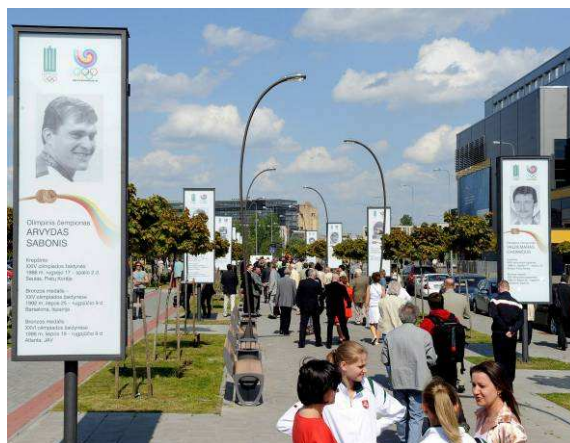
La "avenida de la gloria" en Vilna.