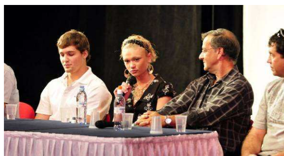
Los participantes de la academia olímpica del CON israelí.

deportivos de verano Lehnsen organizados por el colegio Lehnsen. Estos juegos vienen celebrándose desde hace más de 25 años y son la fiesta deportiva más grande de esta institución educativa. El programa incluye 14 deportes en los que participan 1.700 alumnos en tres niveles: preprimario, primario y secundario. Más información en www.cog.org.gt