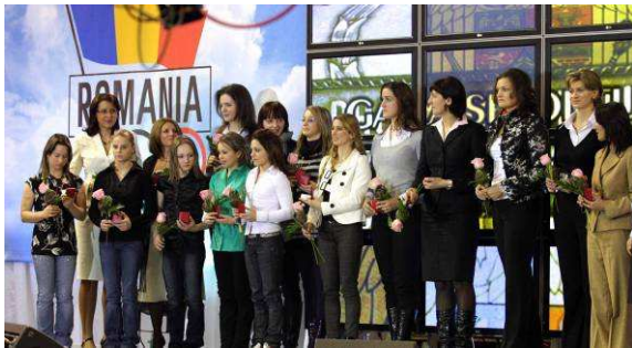
Homenaje a las medallistas rumanas de los Juegos en Pekín.

Ya como profesional, obtuvo varios títulos, en particular en la categoría semipesado.